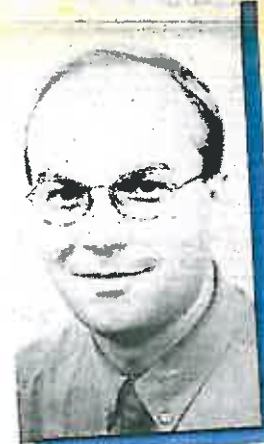
Makelaardij Marc Peters Marc Peters