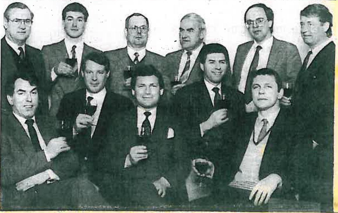
Publiek en makelaars blij met deze nieuwe uitgave...

EEN PERIODIEKE UITGAVE MET EEN DEEL VAN HET VASTGOED-AANBOD UIT UW OMGEVING