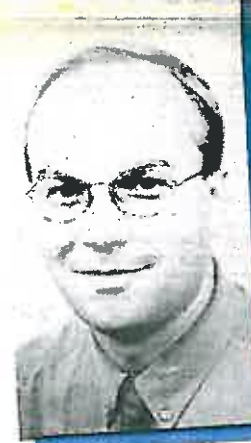
Makelaardij Marc Peters Marc Peters