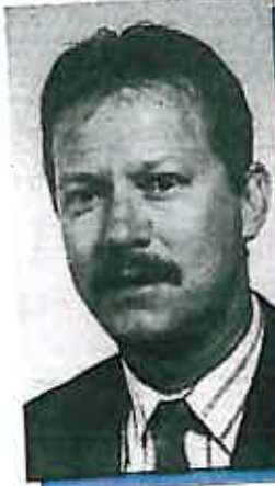
Guyt, van Thiel & Bisterbosch Cuijk Jan Spanbroek